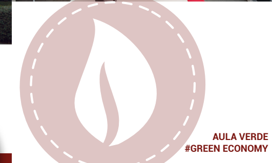
AULA VERDE #GREEN ECONOMY