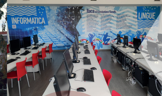
LABORATORIO DI LINGUE E INFORMATICA

Non è necessaria la prenotazione. Gli Open Day si terranno in via Libero Missirini, 10 - Rimini